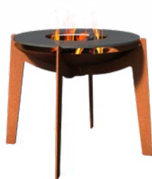
COSA + PLAQUE DE CUISSON