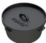
FORNO CASSEROLE EN FONTE