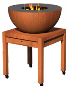
FORNO BULL BTC1