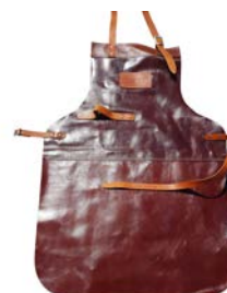
FORNO TABLIER EN CUIR