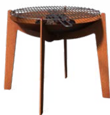
COSA + GRILL