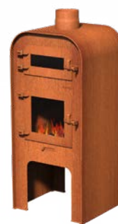
GAP + PIZZA