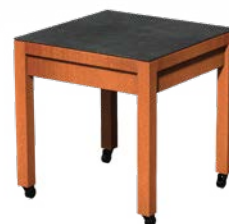
FORNO BULL BTC2